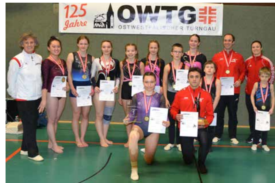
Die jeweils Erst- und Zweitplatzierten der verschiedenen Wettkampfklassen

Gleich 10 junge Turnerinnen kämpften um den Sieg in der WK 5 und hier es kam zu einem kuriosen Punktegleichstand von