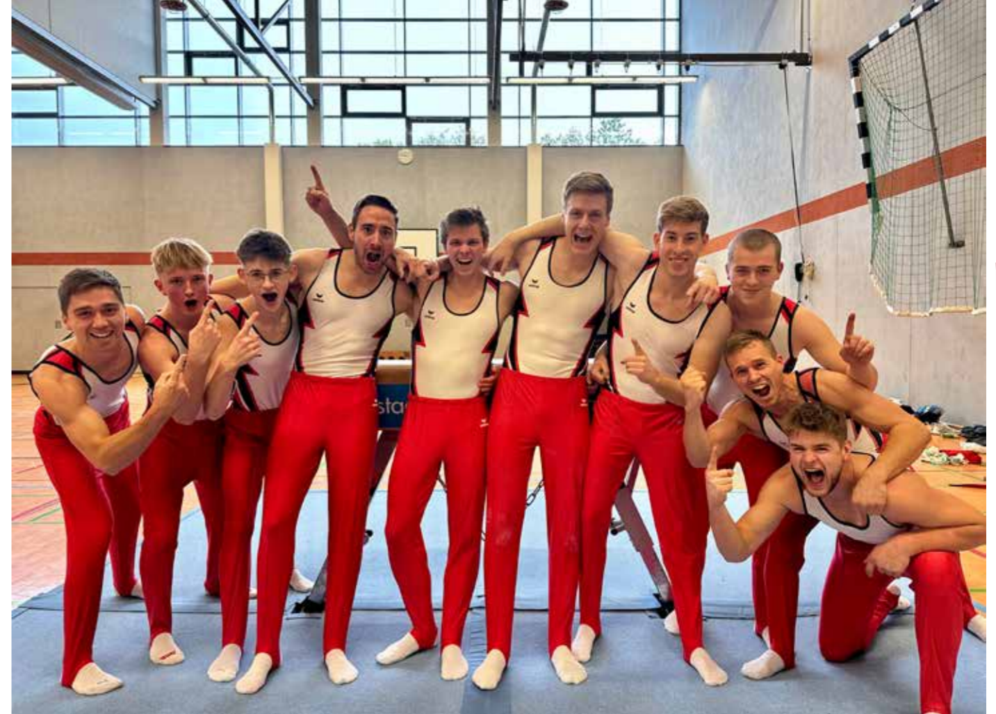
Die Mannschaft vom TSV Kierspe wird Sieger in der Oberliga