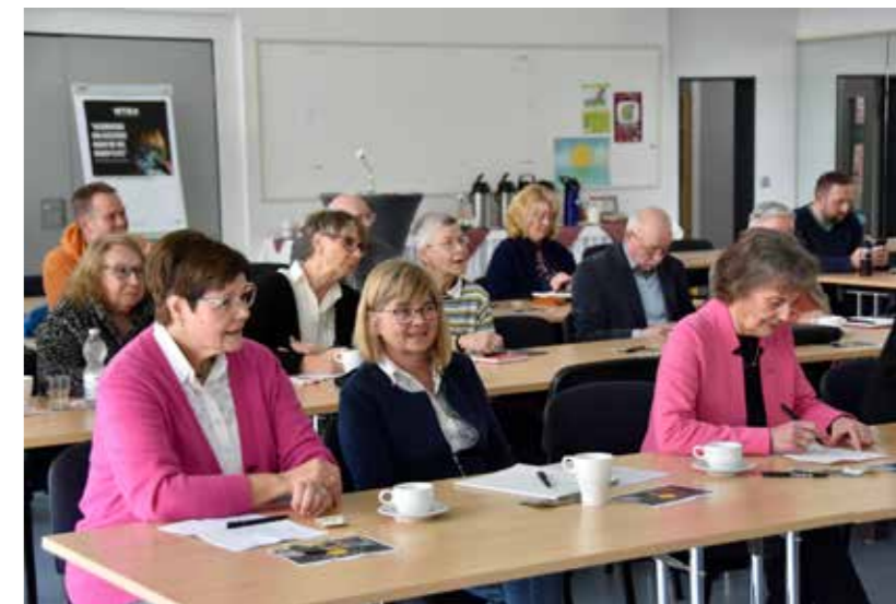
Die anwesenden Mitglieder des Hauptausschusses genehmigten den neuen Investitionshaushalt 2024

Sobald erste Überlegungen zu einem neuen Nutzungskonzept vorliegen, werden diese zunächst im Verbandsrat vorgestellt und beraten. Die spätere Neuausrichtung müsste folgend vom Hauptausschuss bzw. Landesturntag beschlossen werden.