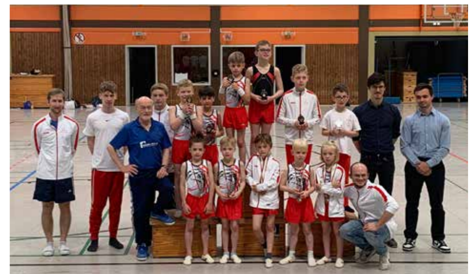
Erfolgreicher TuS-Turner-Nachwuchs beendet die Saison in der Sporthalle Stockum