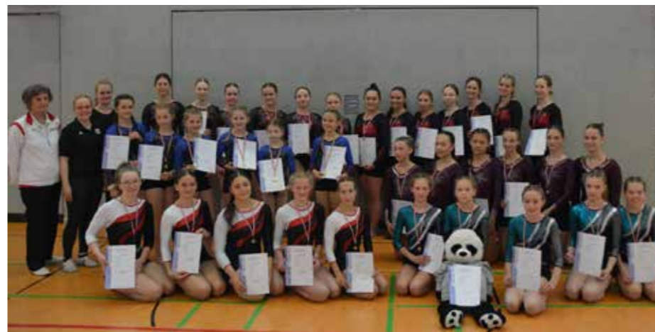
Die drei Erstplatzierten der Liga 3 und 4

Anmeldungen mit Vereinsangabe und Personenzahl bitte bis zum 20. August