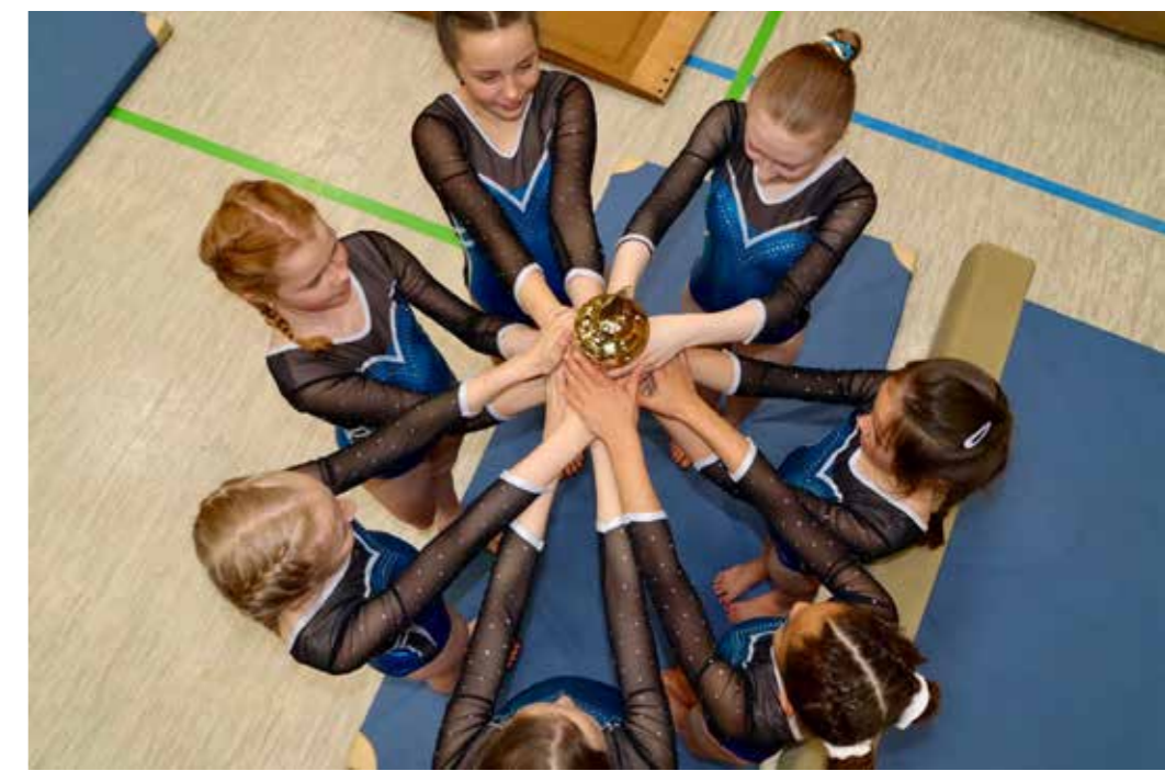
Freude über den Pokal

Am 15. Juni 2024 fand in Belecke der letzte und entscheidende Wettkampf der diesjährigen Gauliga statt. Beide Mannschaften des TuS Belecke, LK4 und LK2, kämpften um den ersten Platz – und siegten in beiden Klassen eindrucksvoll. An dem Wettkampf nahmen auch die Vereine TSV Bigge-Olsberg, TV Brilon und TuS Jahn Fröndenberg teil, was die Konkurrenz besonders stark machte.