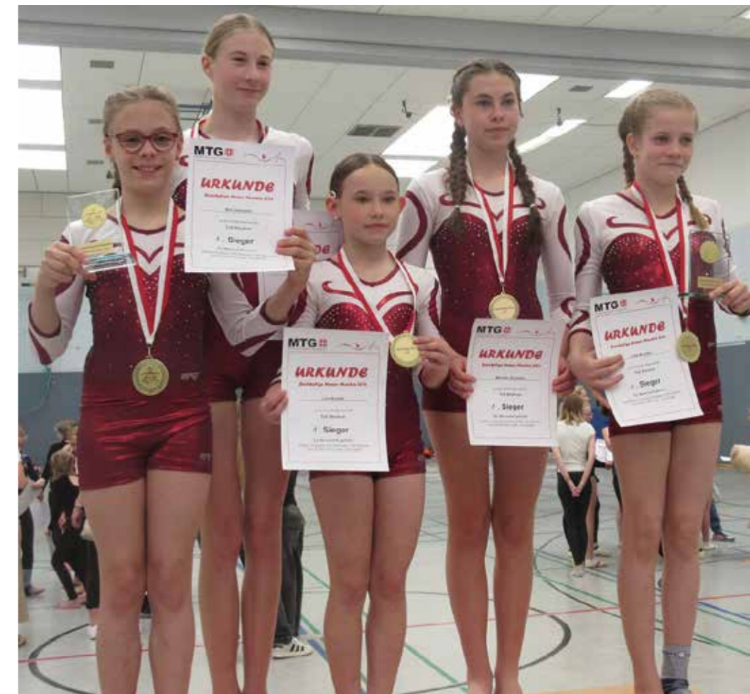
Die Mädchen vom TuS Stockum siegten in der Bezirksliga