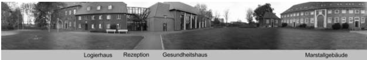
Logierhaus Rezeption Gesundheitshaus Marstallgebäude